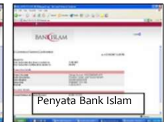
Penyata Bank Islam