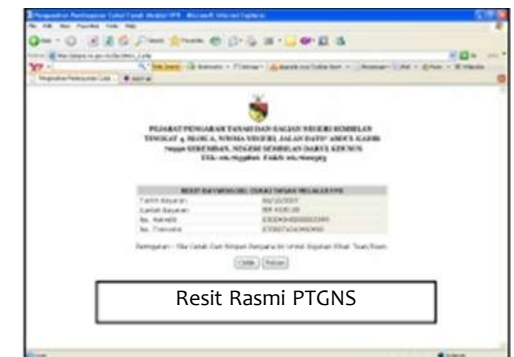
Resit Rasmi PTGNS